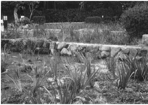
無量寿の裏手の杜若園。一輪咲いているが…

えられ、開花時は多くの人を訪れます。庭を廻ると晩秋にもかかわらず、一輪の杜若の花が咲いていました。寺の裏手に回ると、蛇行して流れる男川が見渡せます。川に出て少し下れば、往きに通った駅前道です。