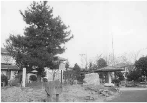
落田中の一本松の史跡