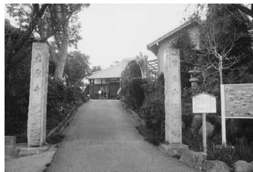
業平の菩提を弔うために創建された在原寺

かきつばた園と大書された門を入ります。寺は8世紀初に慶雲寺として創建されましたが、821年この地に移し無量寿寺としたとあります。これからいけば業平の時代よりも前からあった事になります。境内には杜若が植