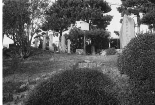
八幡伝説地。 小山の上、石柱に囲まれた中に、小さな墓石がある

街道に戻ると線路を越えた向こうに根上り松があります。根の土が流れて露出した後成長したものでしょうか、「値上がり」が株に関