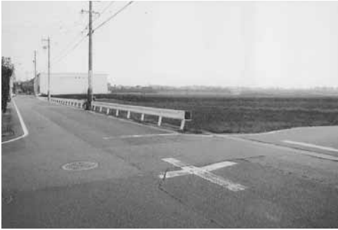
広々とした逢妻男川付近。 この付近に八橋があった？

な公園があり、そのまん中に、「落田中の一本松」の史跡があります。業平がかきつばたの歌を詠んだとされる場所の史跡です。落田というのは田が崩れて落ちた所といいますが、史跡の位置は宅地造成で動いているようです。