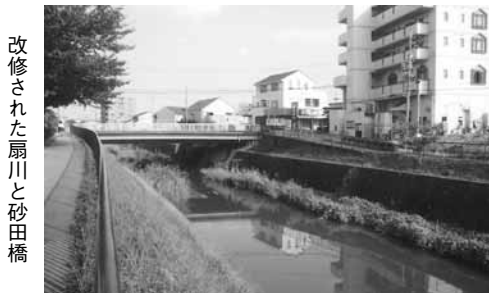
改修された扇川と砂田橋