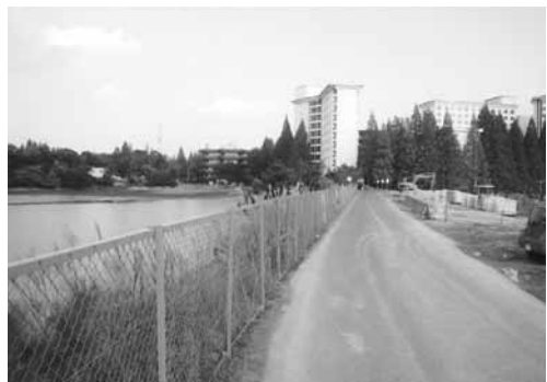
濁池のむこうに保健衛生大学の建物が並ぶ