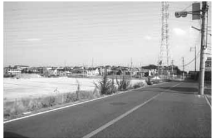
▲宅地化の進むハツ松