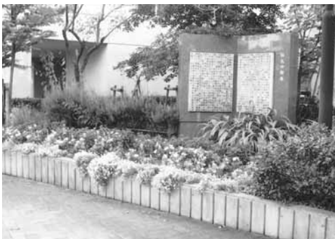
鎌倉台中学。命名のいわれが書かれている