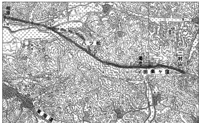
図3 相原から二村山へ(明治中頃)

道は浄蓮寺に向かって進み、寺の裏を通過しています。この寺は桶狭間の戦いの後、今川義元の家来が出家して建立しました。戦国時代の末にここに移ったといわれています。街道跡といわれる道は寺の東から小路をたどります。面白いのは寺の1本東から駐車場を抜ける所で、昔の道のルートがブロックを埋め込んで残してあります。街道跡といわれる道はそこを抜けて段を降り、左・右と細い道を辿ってハ