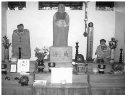
もつとも古い身代り地蔵。左のお地蔵さんが峠の地蔵堂。