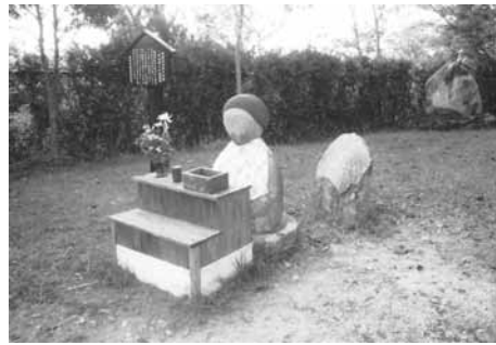
江戸時代につくられた袈裟切り地蔵

は上半身と下半身の分かれた袈裟切り地蔵があります。今は大きな木が茂って一部の方向にしか視界はありませんが、当時は三河の山々からあゆち湯、濃尾平野の向こうまで望めた景勝の地でした。今は横に展望台が作られており、それを上ると名古屋市街から三河平野まで望むことが出来ます。帰路は、峠から保健衛生大学の前に戻ると幾つもの方向にバスが出ています。