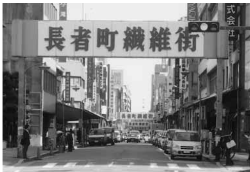
長者町通のにぎわい

その角を右に曲ると長者町通です。付近は繊維の街として賑やかでした。この道も5.5メートルから15メートルに拡幅されています。拡幅されて車が楽に入るようになり一時活気がありましたが、今の繊維街には昔日の元気さはありません。変わってこの地域の空きビルをベンチャービジネスの拠点にしようという運動が始