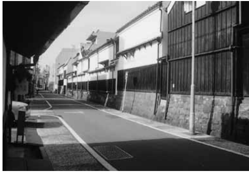
四間道の白壁の通り

車の時代では4間でも狭い道です。南に進むと、そのとき火が移らないようにと計画的に造られた白い土壁の蔵がつづき、見事な景観をつくっています。この付近は最近、この古い町並みが見直され、レストランや小物を売る店が出来て、若い人が集まり始めました。