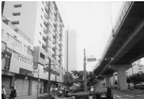
幅50メートルの江川線をつくるために行われた市街地の再開発事業

連続した蔵が終わった辺りで右に入ると幅5、6メートル以下の道路ばかりになり、こじんまりした住宅街になります。栄付近も区画整理の前はこのような状況だったのでしょうか。突き当りを南に曲がると直ぐ国際センターの高層ビルの東側に出ます。その先は桜通です。