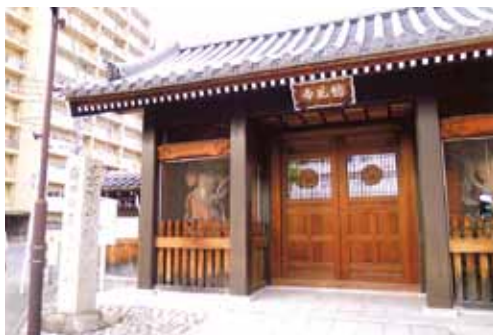
現在の総見寺の門。 この奥に信長の墓がある(現在工事中)

さて、赤門の信号を渡り右に、2本目を左に曲がると小さな公園の左向こうに現在の総見寺があります。信長の二男・信雄が父の菩提を弔うため伊勢につくったものが、清須を経てここに移りました。いつもは公開されていませんが信長の墓所がある寺です(現在は本堂等の改築中)。ここでは、その一帯にま