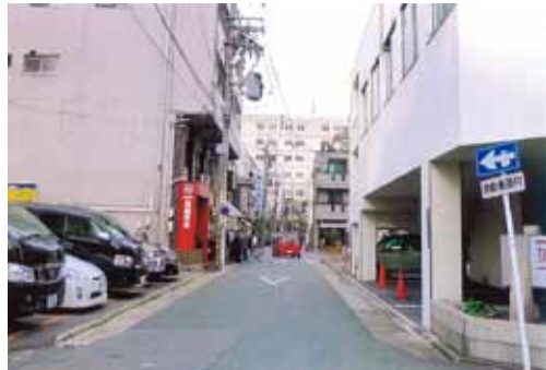
博物館のあった総見寺裏。 区画整理で道路ができた