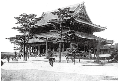
図2 戦災で焼失する前の東別院本堂(文献④) 400程、まだ古美術品が多かったようです。

次は、7年に東別院で行われた名古屋博覧会です(図2)。5月11日から30日までの予定でしたが、出品数が増え、会場は西別院が追加され、会期も6月10日まで延長されています。ここには無用と下におろされていた名古屋城の金のシャチも展示されました。