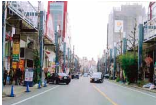
大須の本町通。門前町