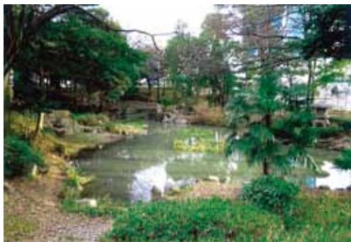
古渡城跡(天守付近)とされる下茶屋公園。 下の池は堀を改修したものとされる

本堂は、名古屋で最大の建物とされ、別棟も多かったため、7年の名古屋博が開かれたのでしょ。ここには博覧会の後、軍に庁舎を取られた県庁が移ってきたほか、11年の明治天皇のご巡幸の時の宿舎にもなりました。東の門を出ると右に名古屋テレビ、左に下茶