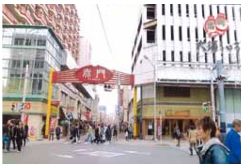
本町通の奥に総見寺の広大な敷地があった。 赤門通はその後につくられた

地下鉄の大須観音駅のエレベーター出口を出て、すぐ北の道を東に入ります。この道は、赤門通と呼ばれ、大正頃、大須を東西に結ぶ幹線道路として新設されました。左に大