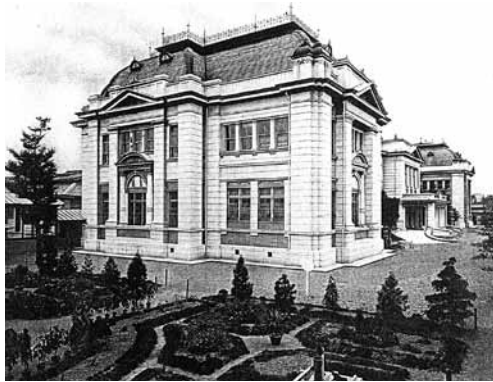
図4 愛知県商品陳列館。 横側から見たところ(文献⑤)