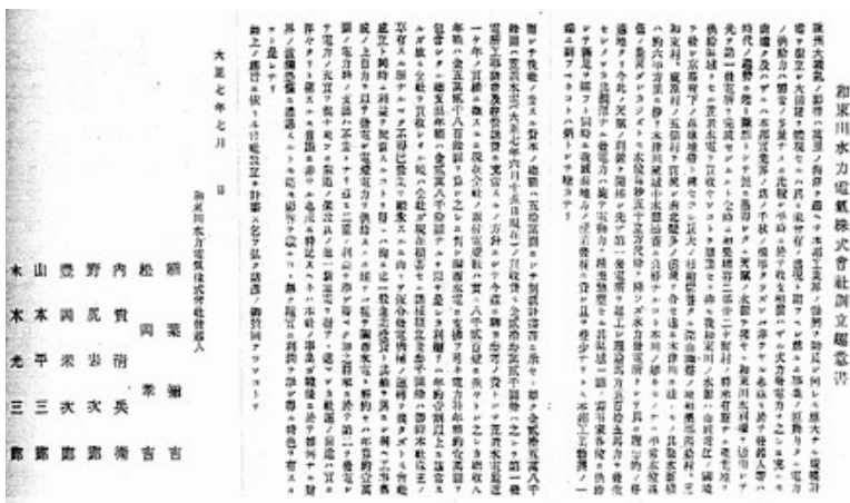
和東川水力電気創立趣意書