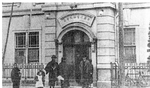
浜松市伝馬町の日英水電浜松営業所 (東京電力浜松営業所も同じ社屋)