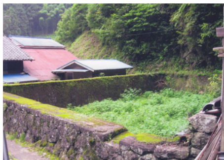
朝比奈水力電気の発電所貯水槽跡

このように、地方名望家として山城水力電気の常務としてスタートした松岡は、大正末から激変