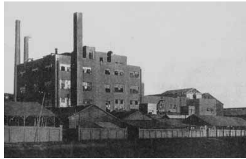
創業時の東海電極製造(大正7年4月創設) (出典：『東海電極製造35年史』)

1975年(昭和50)、カーボンブラックを始め電極以外の製品も多くなり東海カーボン(株)に社名を変更した。