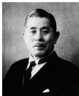
寒川恒貞 (『寒川恒貞自伝』より)

福沢桃介は海外視察から戻った寒川に、「名古屋電灯には今、水力が5,000 キロ 余っている。1 キロ 5厘でもよいかから、このさい何か利用法を考えて貰いたい」と命じた。この要請が、寒川の後半生を大きく変えることになった。その後、電気製鋼事業・電極事業などの会社を設立し華々しく活躍した。