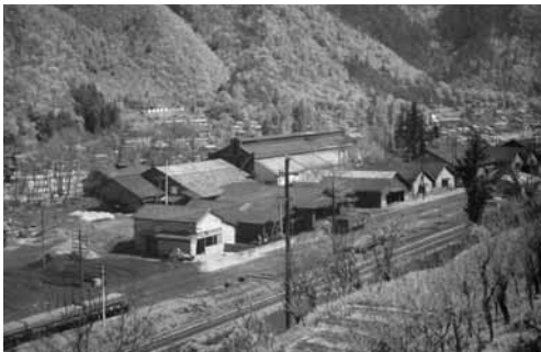
電気製鋼所 福島工場(大正8年2月)

在、大同特殊鋼知多工場に社宝として保存展示されており、1983年(昭和63)、米国金属協会から歴史的遺産(Historical Landmark)として認証された。さらに2007年(平成19)に経済産業省より近代化産業遺産の認定を受けた。