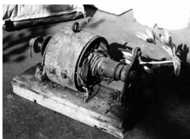
16歳の時製作した発電機