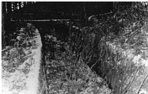
佐見川第1発電所用水路遺構