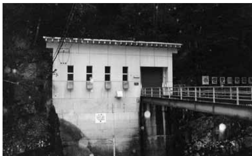
佐見川発電所現況(330kW)