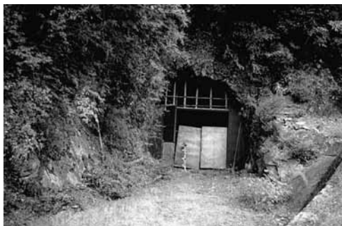
保井戸トンネル(現況)

きは260kWであった。この工事資金の支払いを巡って会社側と篠田電機とで争いになり、前後10年に及ぶ裁判を経て敗訴し、借財を抱えて篠田兄弟は事業から手を引いた。佐見川第二発電所は現役発電所として今も稼動している。その後、義彦・敏司兄弟は電気事業を離れ、義彦は砂利の採取や軍用バッテリーの製造、敏司は自動車修理業を営んだ。昭和20年、義彦は56歳で逝去、一方敏司は昭和48年81歳で亡くなった。技術的才能はあったが、経営的には芥見発電所の挫折や佐見川発電所のトラブルに見舞われ、事業家として大成できなかった。(浅野 伸一)