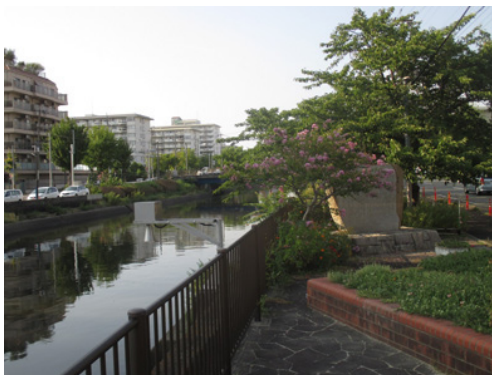
明治末に完成した新堀川。 周辺は耕地整理で工場用地等になっていった

階段を降りて、右にまっすぐ坂を下ります。東西・南北に仕切られた区画は、まさに耕地整理の遺跡です。沿道には蔵のある古い立派な家もあります。坂を下りきると高速の走る道。拡幅されてはいますが耕地整理でできた南北の幹線道路です。信号がないので左に行き、次の信号で道路を渡ってそのまま進むと新堀川に出ます。左に、川に沿って歩くとすぐ、新堀川の記念碑があります。この運河と耕地整理が、大正から昭和にかけて周辺を工場用地に変えました。そして、名古屋を工業都市へと導いたのです。下流の橋を渡って西に行くと、名鉄の神宮前駅があります。