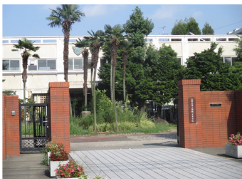
瑞穂ヶ丘中学の正門は五中正門の位置で、 イメージが残る