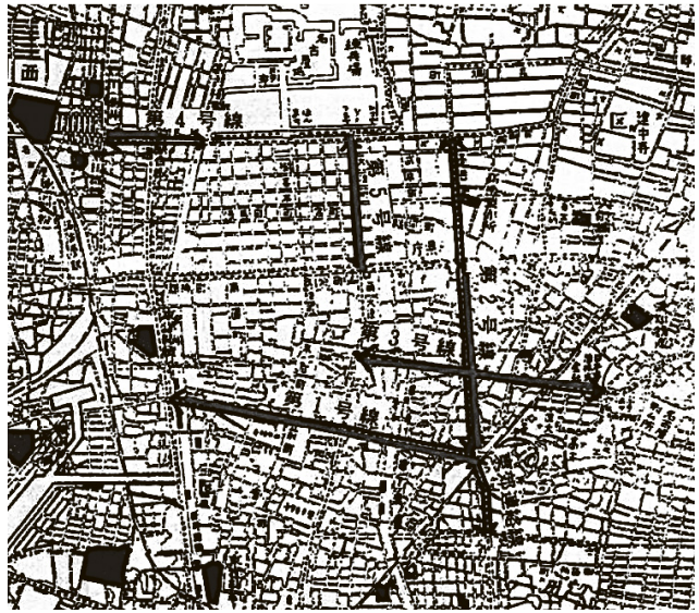
図3 市区改正委員会が出した「五大幹線道路」。 1号から5号までである(文献④)

地下鉄の鶴舞公園駅の5番出口を出て、JRのガードをくぐります。左側が鶴舞公園で、その中に図書館があります。ここから南が東郊耕地整理組合の区域でした。