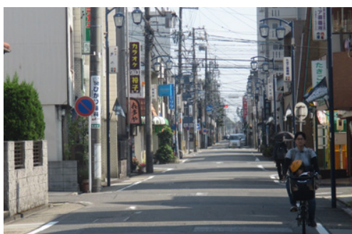
明治末に整備された郡道(千種街道)。 現在も、商店が並ぶ