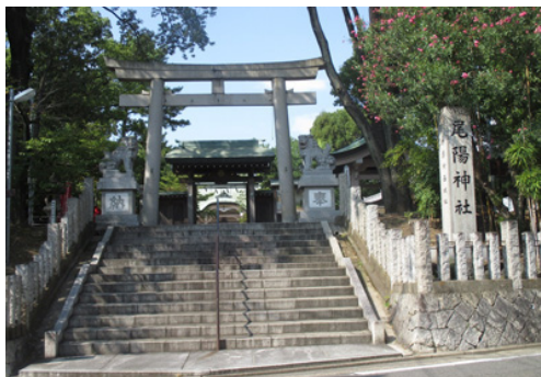
開府三百年記念でつくられた尾陽神社。 御器所西城の跡になる