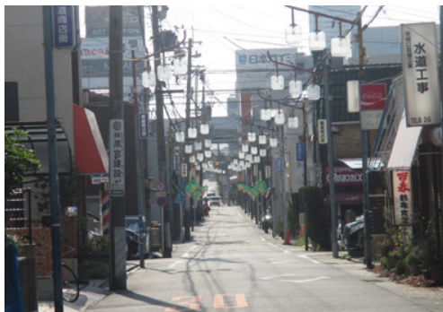
郡道熱田街道は、その後雁道の商店街としてにぎわった