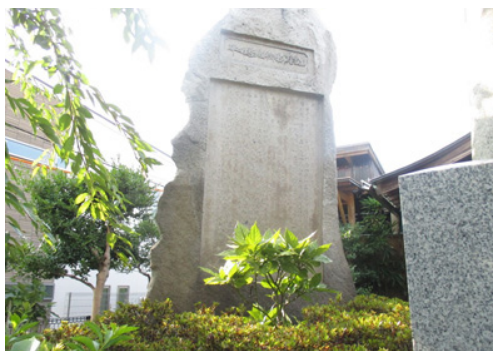
直来神社の「東郊耕地整理の碑」(S13)。 案内がないのが寂しい

す。その手前の道を左に少し行くと左側の高台に直来神社があります。階段を上がると左側の大きな石碑が、昭和13年に造られた東郊耕地整理の記念碑です。組合ができて20年余。様々な苦労が石に刻み込まれているようです。