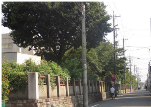
つづく八高跡の塀。 昔のレンガの上にモルタルが塗ってある

少し戻って西に進みます。この道は郡道高田街道でした。雁道の商店街を経て熱田駅につながる五中の通学路だったのです。坂を下ります。寄り道をするため、3本目を左に曲がります。500m程行くと高田小学校に出ま