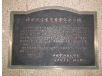
中部電力の電気文化会館と 記念プレート

会館が建設され、でんきの科学館がオープンした。また、地下2階にあるザ・コンサートホールは名古屋フィルハーモニー交響楽団の演奏会、中村紘子さんのピアノ・コンサートのこけら落としから始まった。