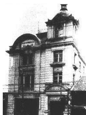
名古屋電燈の本社建屋