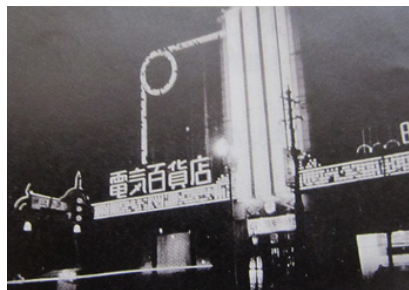
東邦電力の電気百貨店