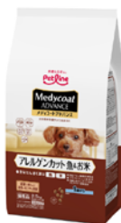
メディコートアドバンス

愛猫の「下部尿路の健康維持」フード メディファスから 「進化」した価値と「深化」した機能。