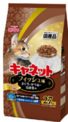
キャネットチップ

日本初のドライキャットフードの発売をはじめ、機能性を追求した総合栄養食や療法食まで、幅広い商品ラインアップを展開しています。