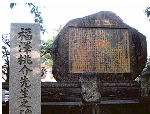
福沢桃介君追憶碑

この碑は、桃介が没してから3年後の1940(昭和15)年11月に、下出民義(明治から大正時代にかけて名古屋に近代産業を興しリーダーとして活躍、また東邦学園の創立者として知られる)が發起世話人となり、当時の大同電力・東邦電力・名古屋鉄道・矢作製鉄・大同製鋼の5社が協賛して建てられた。撰文は「二千五百年史」の著者で歴史学者の竹腰興三郎、書は書道芸術員創立時の發起人の一人である野本白雲である。